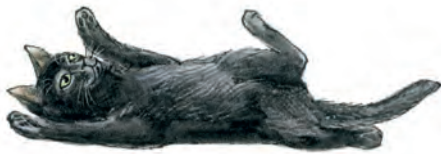
Die Katze ist spielbereit